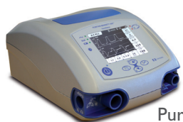
Puritan Bennett 560

weitere aktuelle Informationen erhalten Sie unter: hul.de