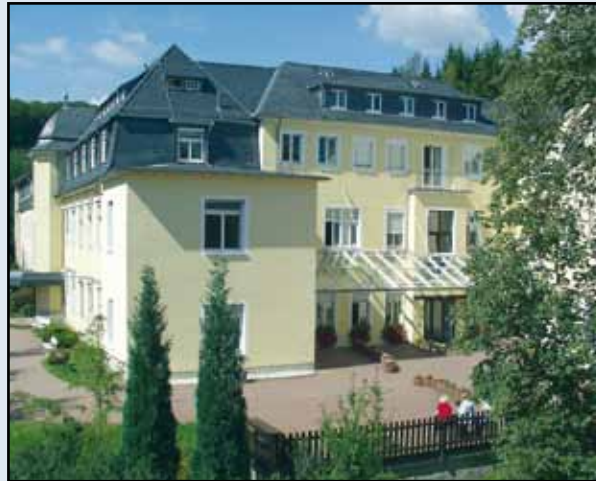
Pneumologische Klinik Waldhof Elgershausen