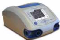
Puritan Bennett 560

weitere aktuelle Informationen erhalten Sie unter www.hul.de